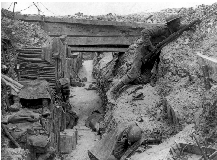
Imagen de una trinchera cerca de la Boisselle durante la batalla de Somme en julio de 1917.